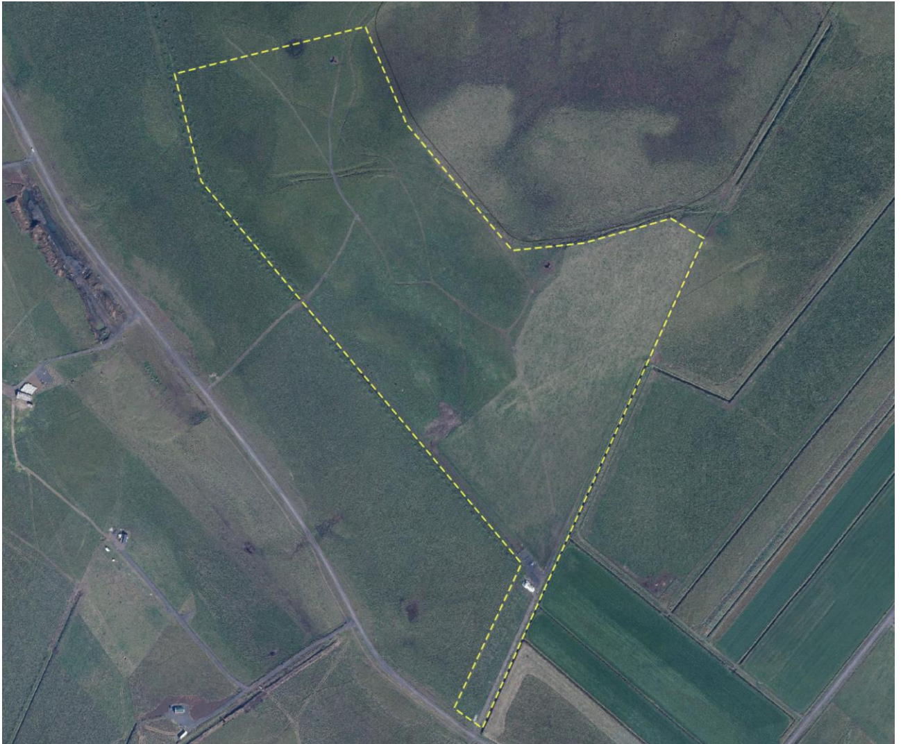
Mynd 1. Skipulagssvæði deiliskipulagsins er afmarkað með gulri línu.

Svæðið er fremur flatt og grasi gróið en aðliggjandi svæði til norðurs er skráð sem votlendi skv. lista Náttúrufræðistofnunar Íslands og það flokkað sem Starungsmýravist með mjög hátt verndargildi. Skipulagssvæðið nær ekki inn á skilgreint votlendissvæði.