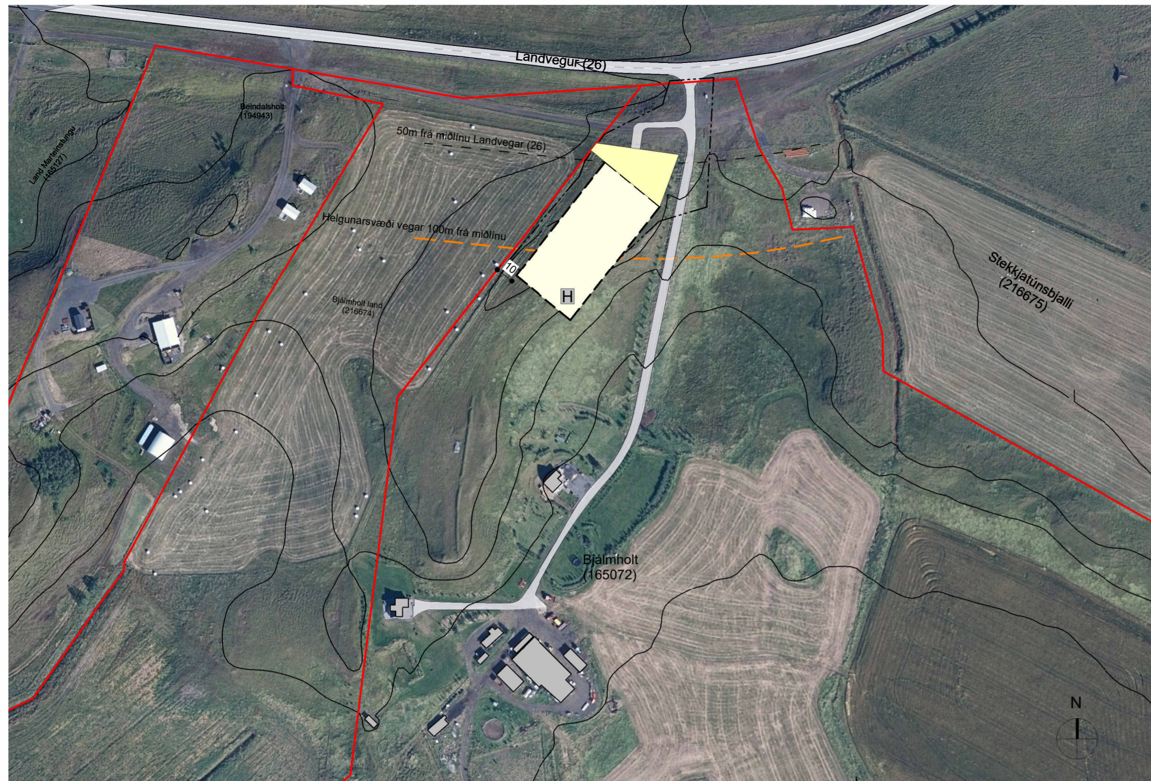
Deiliskipulagsuppráttur í mkv. 1:2000