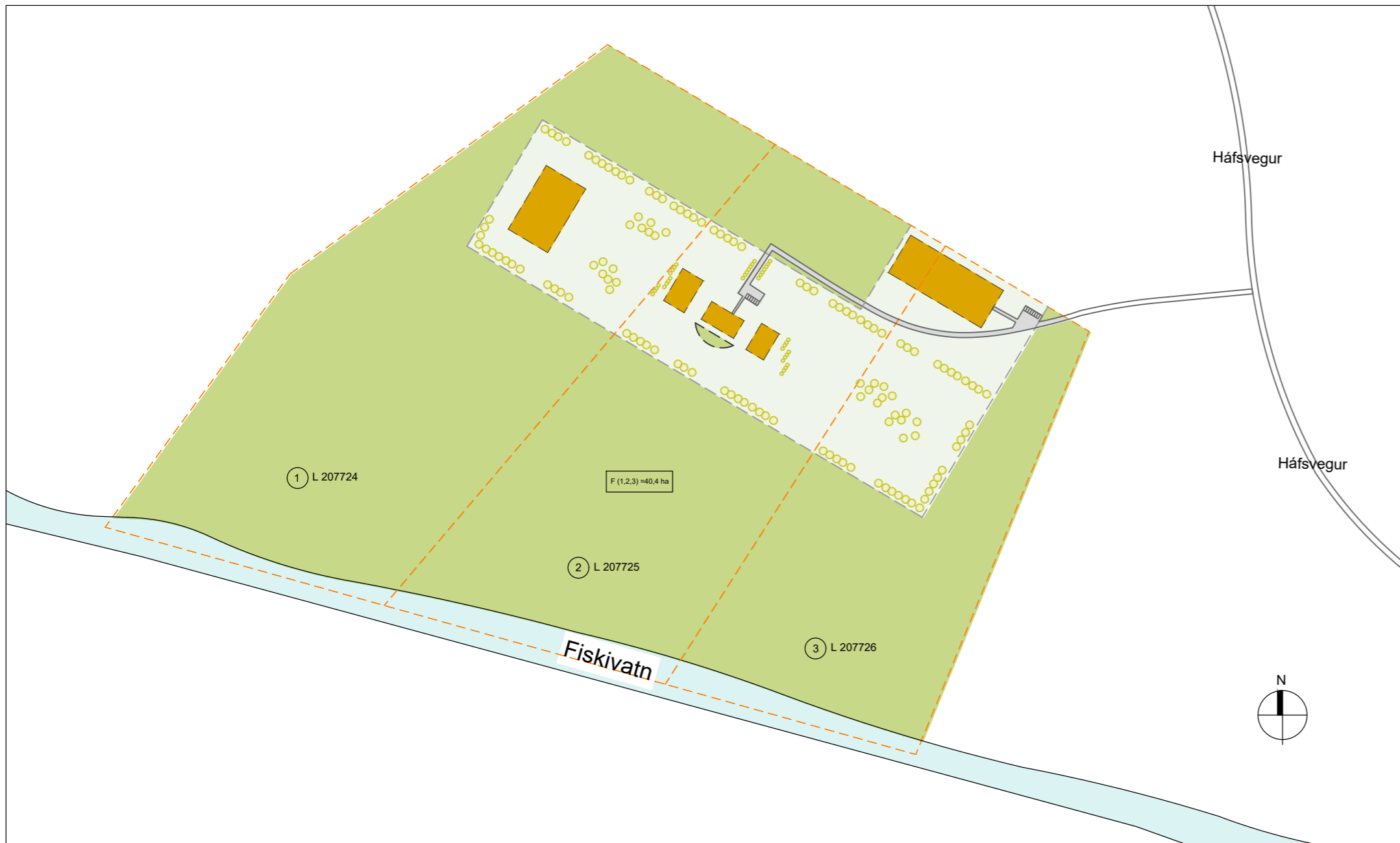
núv. land 1:5000