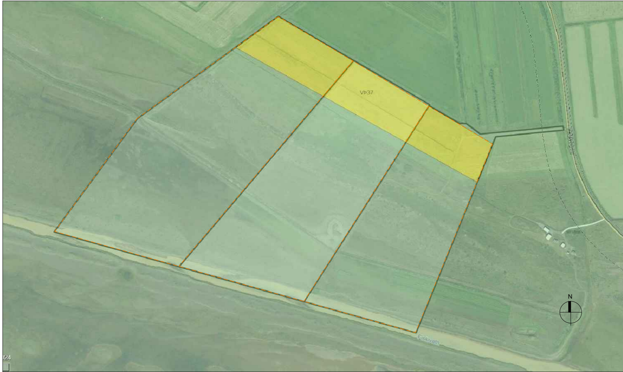
Tillaga að deiliskipulagi : byggingarreitir/ aðkoma 1:5000