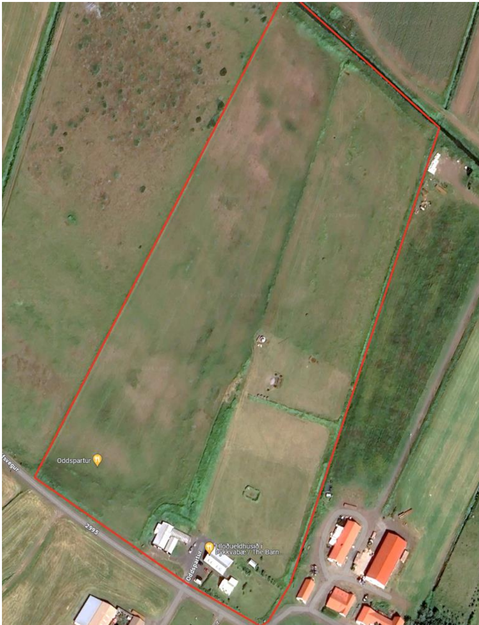
MYND 1. Skipulagssvæðið er innan rauða flákans.