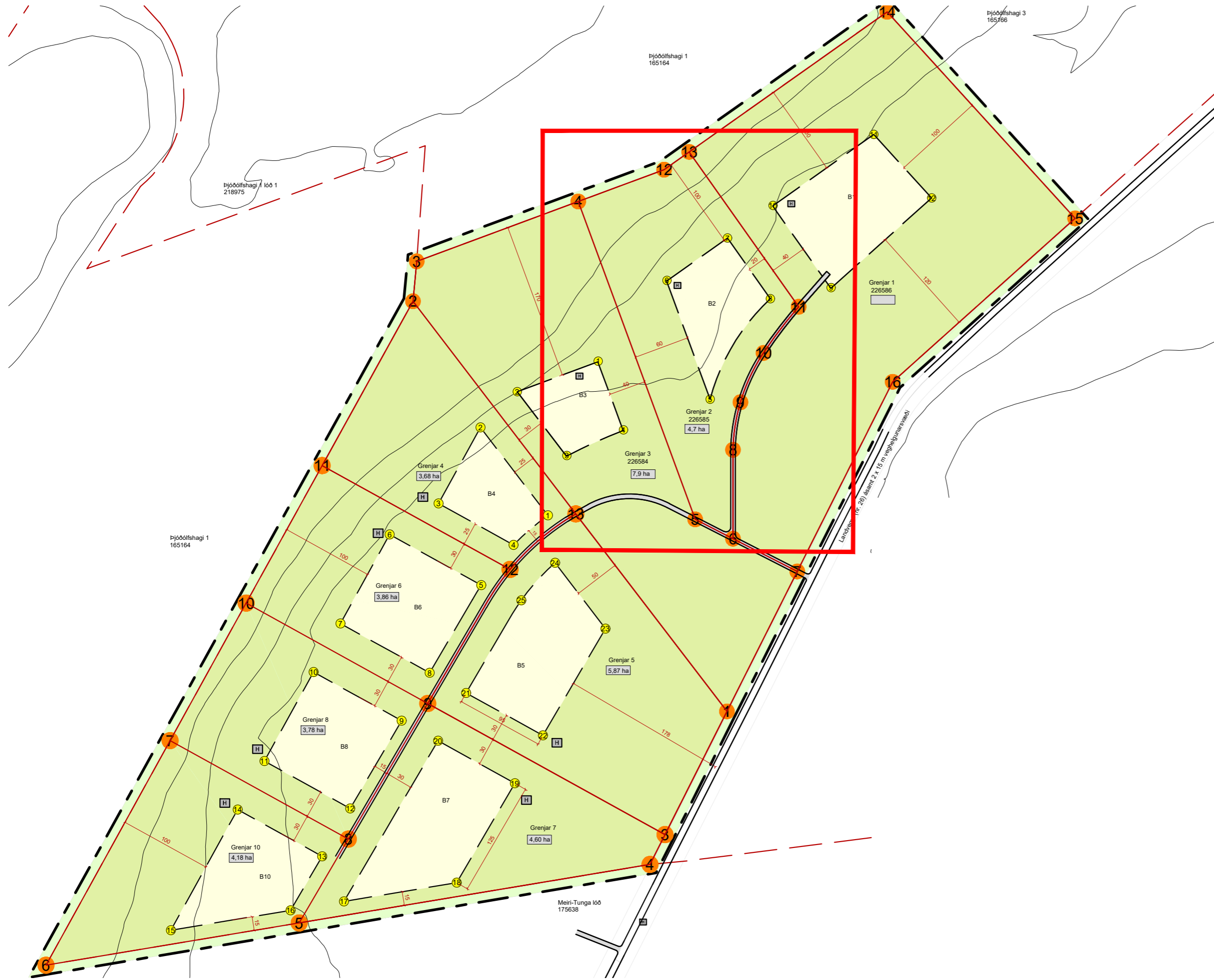
GILDANDI DEILISKIPULAGSUPÐRÁTTUR EKKI Í MKV. Svæðið sem breytingin nær til er innan rauða rammans.