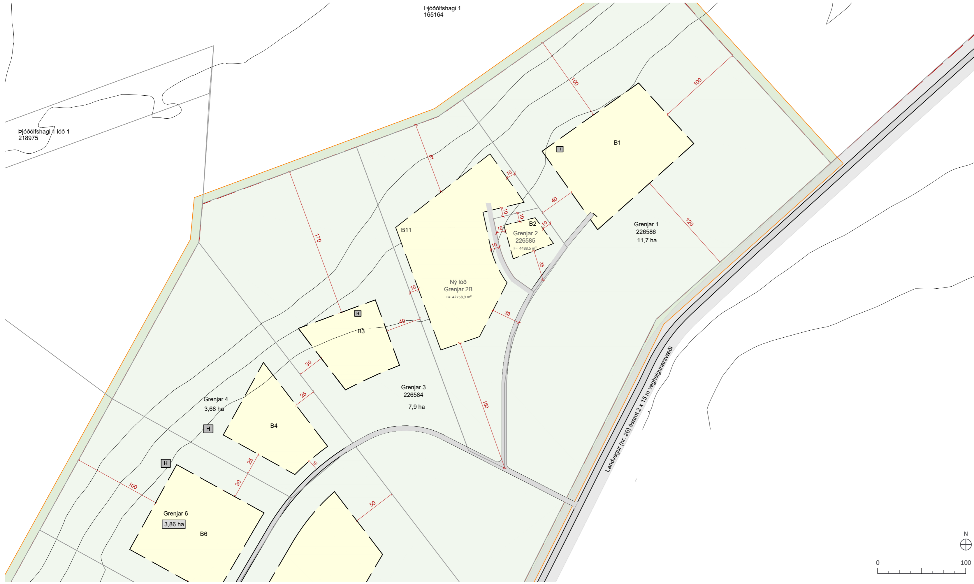
BREYTTUR DEILISKIPULAGS UPÐRÁTTUR MKV 1:2500