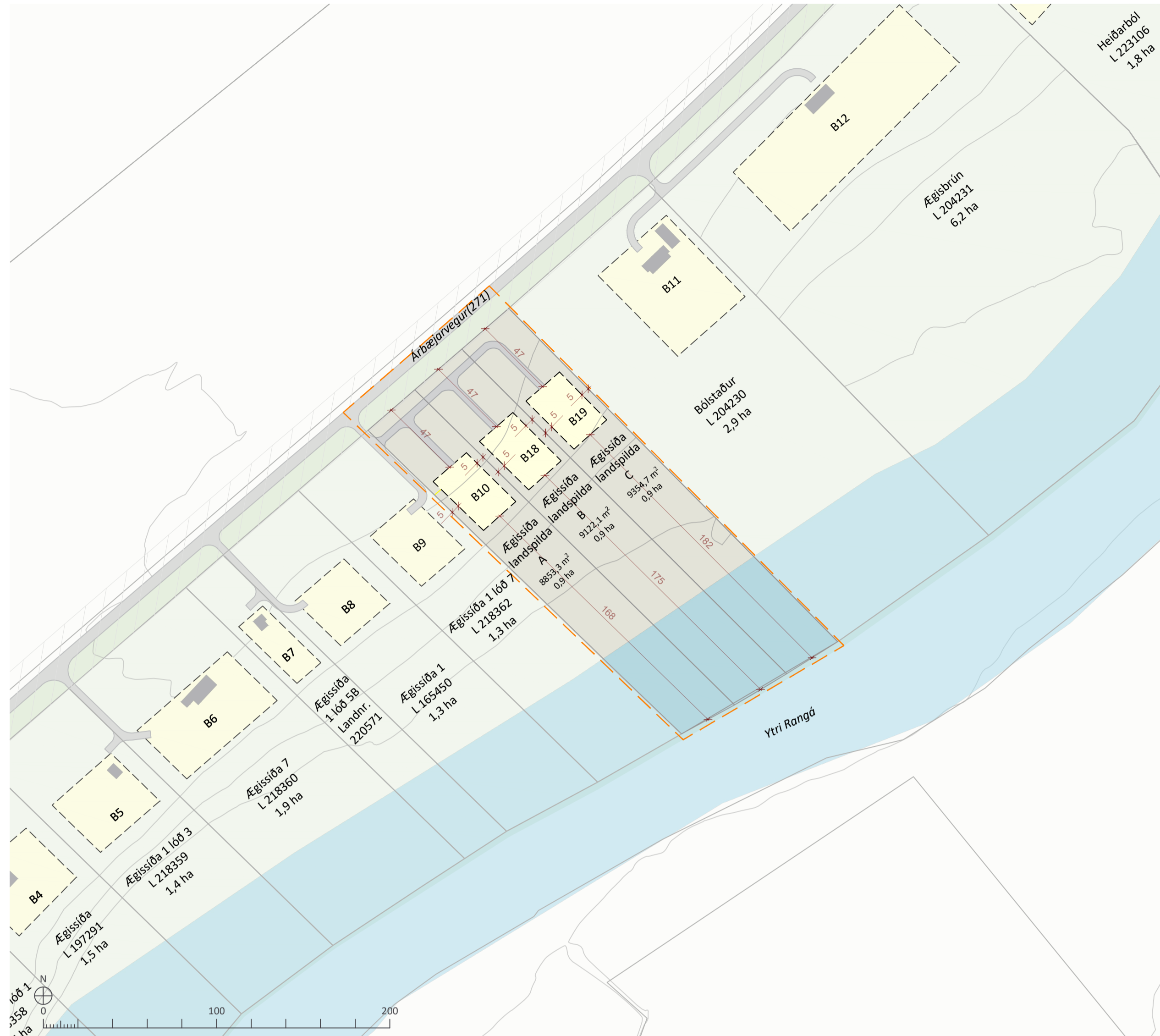
BREYTTUR DEILISKIPULAGSUPPRÁTTUR MKV. 1:2000