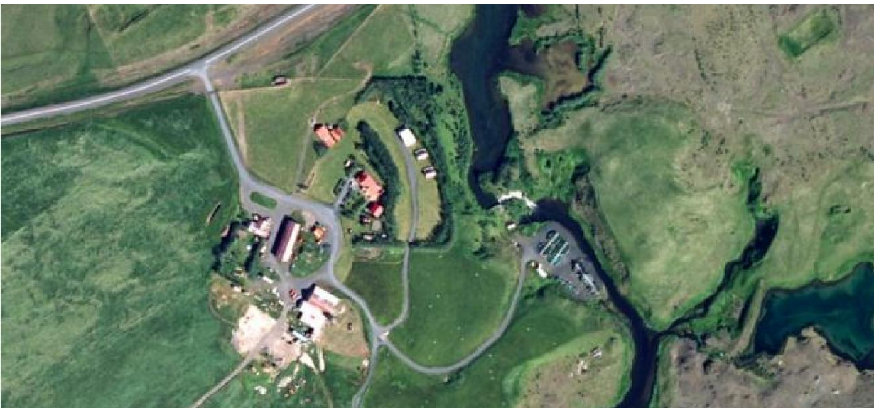
Mynd 1. Loftmynd af Galtalæk, fiskeldisker eru hægra megin við miðja mynd.

Jörðin Galtalækur er efst í Landsveit, liggur að Galtalæk og Ytri-Rangá. Gert er ráð fyrir iðnaðarsvæði nálægt núverandi bæjarhúsum. Aðkoma er af Landvegi nr. 26 og heimreið að Galtalæk og gert er ráð fyrir sömu aðkomu áfram. Fiskeldi í kerum hefur verið stundað um langt skeið á svæðinu og framleiðsla aukist á seinni árum.