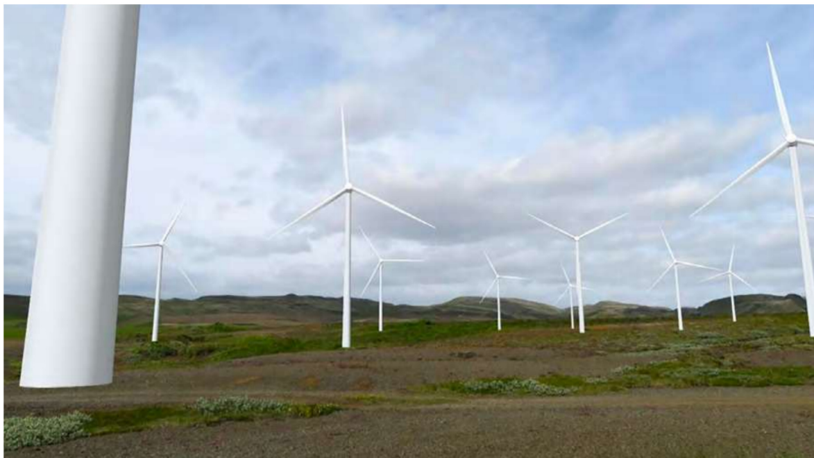
Aðstæður og mögulegt útlit vindlunda Hrútmúlavirkjunar, úr skýrslu Eflu frá 2020 fyrir Gunnbjörn ehf.