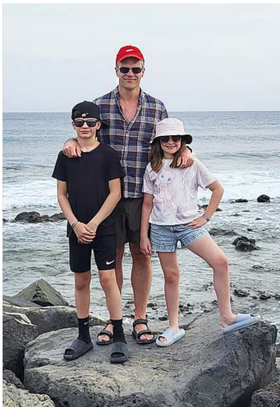
Með börnunum Á góðri stund á Tenerife 2024.