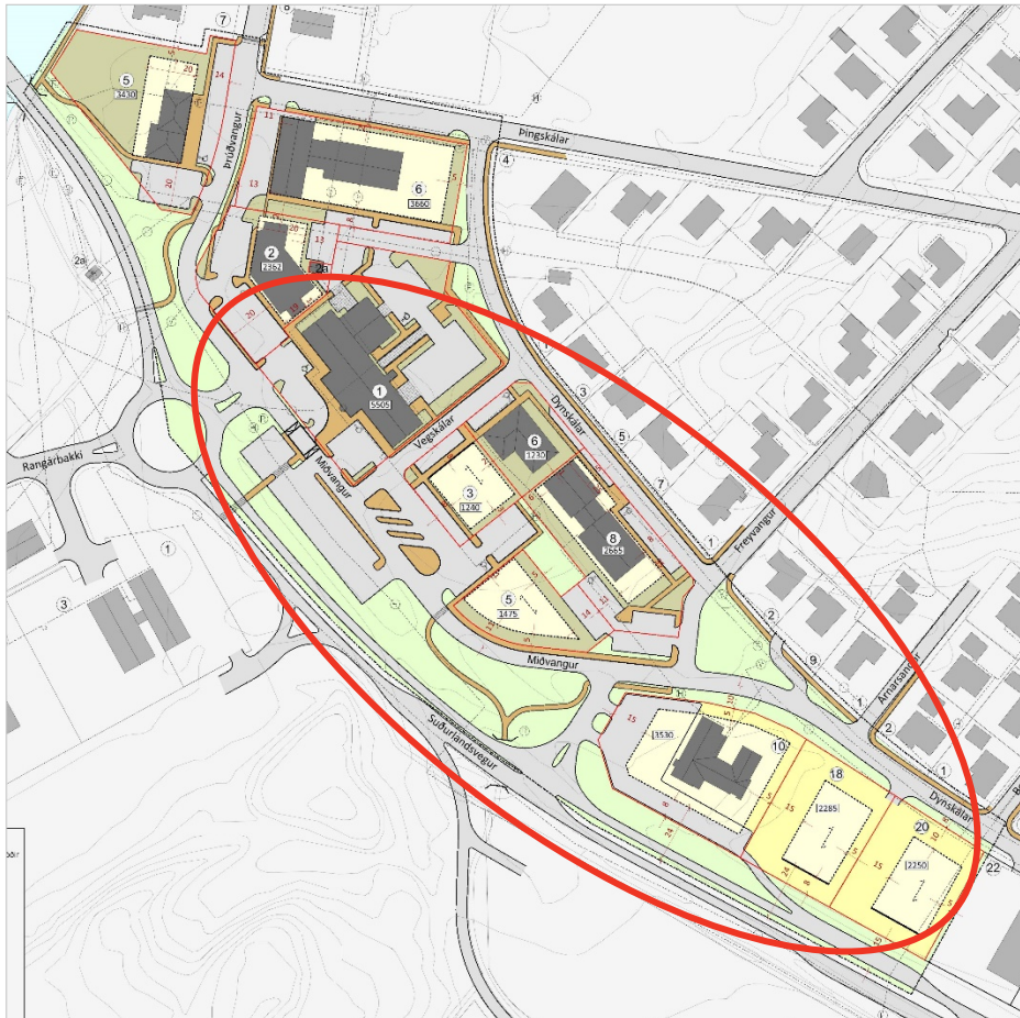
MYND 2. Deiliskipulag fyrir miðsvæði á Hellu. Breytingin nær yfir svæðið innan rauða hringsins.

Deiliskipulag fyrir miðbæjarsvæðið á Hellu var staðfest í B deild í mars 2013. Á því svæði sem deiliskipulagsbreytingin nær yfir er gert ráð fyrir 5 lóðum og nýrri götu, Miðvangi. Þá breytist lega Dynskála og Freyvangs.