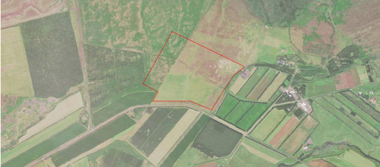
MYND 1. Gunnarsholt - Skipulagssvæðið er innan rauða flákans.