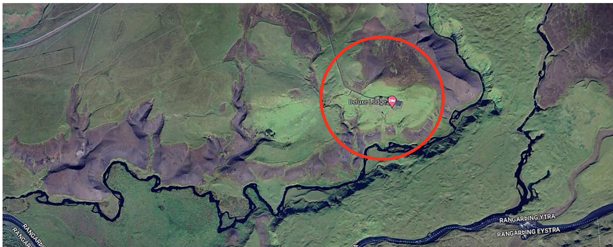
MYND 1. Skipulagssvæðið er innan rauða hringsins.

Samkvæmt vistgerðarkortlagningu NÍ er svæðið skilgreint sem tún og akurlendi en er einnig innan VOT-S 3 Suðurlandsundirlendi sem er mikilvægt fuglaverndunarsvæði.